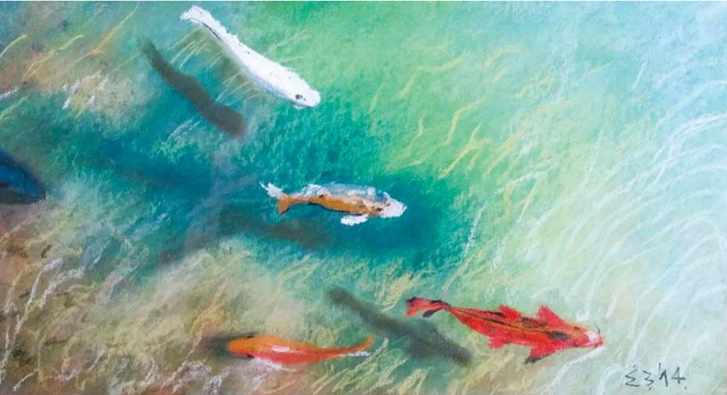
SKROMNOST pastel 44 cm. x 34 cm.