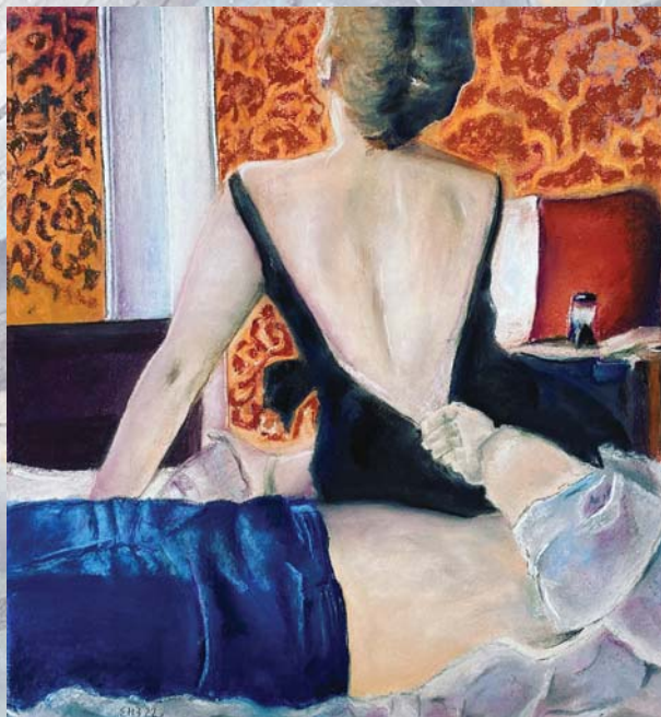
SRPSKA EROTIKA-UNA pastel 46.5 cm. x 50.5 cm.