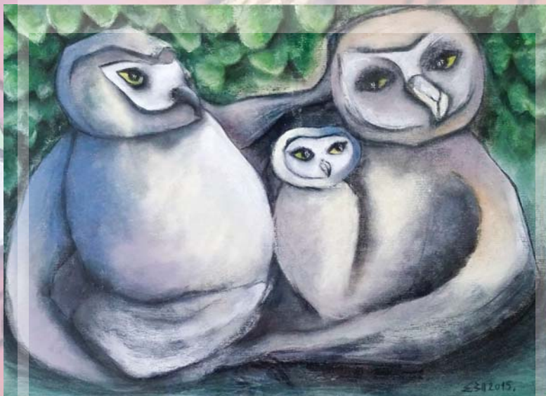
UŠUŠKAVANJE pastel, 45 cm. x 32,5 cm.