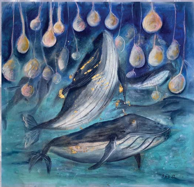
JEDNE LETNJE NOĆI kombinovana tehnika 67.5 cm. x 66.5 cm.