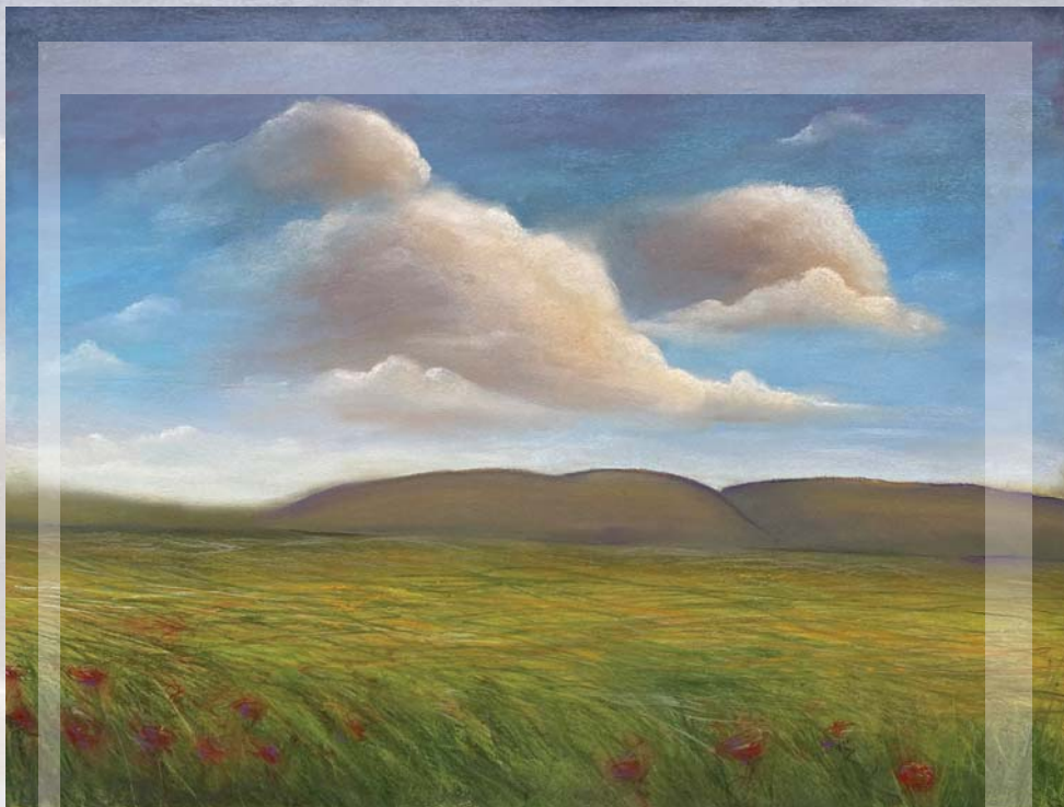
TITELSKI BREG pastel 60.5 cm. x 45 cm.