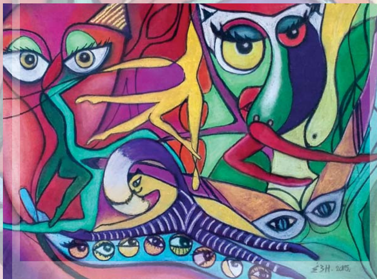
MAČKE pastel, 36,5 cm. x 27 cm.