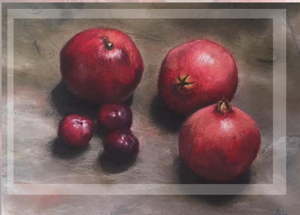
NAR I ŠLJIVE pastel 28,5 cm. x 21 cm.