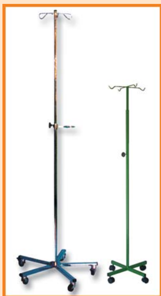
Stativi za infuziju sa točkovima i podešavanjem visine.