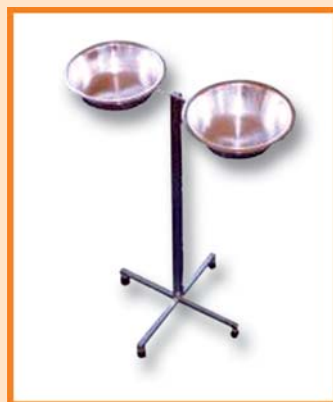
Stativ za dezinfekciju sa dva lavora.