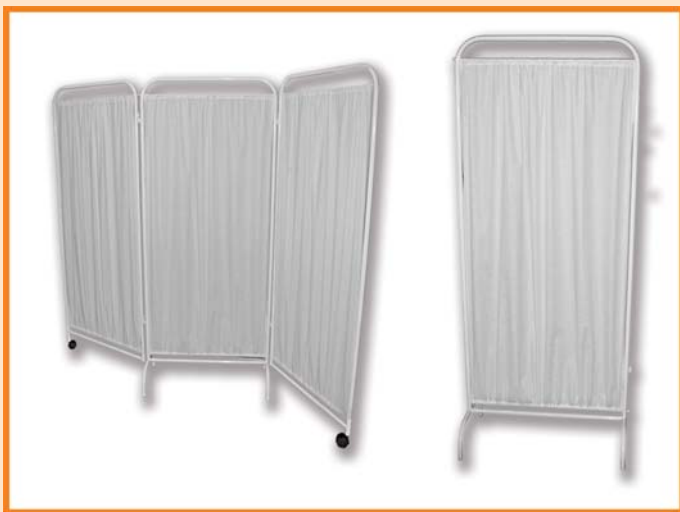
Paravan - jednodelni, dvodelni i trodelni sa platnom.